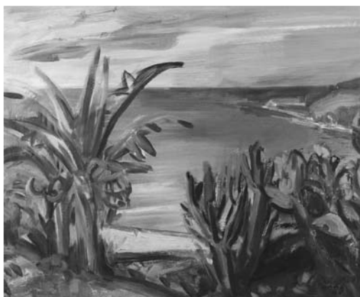
Tengerpart banánfákkal , 1988, olajtempera, farost, magántulajdon

ábrázoló alkotása, amelyen szinte érzékelhető a fülledt, párás atmoszféra, a déli nap vakító ragyogása. Hasonló kompozíciós megoldással készültek többek között a Bolgár tengerpart (1968, olajtempera, farost, Miskolc Megyei Jogú Város Önkormányzata), a Cataniai-öböl (1968, pasztell, papír, Miskolci Egyetem), a Panzió Amalfinál (1969, pasztell, papír, magántulajdon) és a Sziklás part Malagánál (1973, olajtempera, farost, magántulajdon) című festményei. A másik verzióhoz tartozó alkotásokon a három elem, föld, víz, levegő frontálisan egymás mögé kerül, mint a horizontális rétegek. A partszakasz barna tónusaival, illetve a víz kékjének valőrjeivel egzotikus tájképi hangulatot, valamint tónusbeli harmóniát teremt meg ( Tengerpart , 1980, olajtempera, farost, magántulajdon; Napospart , 1982, olajtempera, vászon, Miskolc Megyei Jogú Város Önkormányzata).