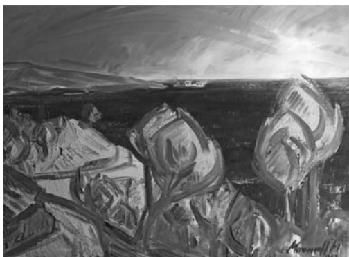
Várnai-öböl , 1967, olajtempera, farost, magántulajdon

A mediterrán tengerparti képek egyik sajátos típusán, – amelyen szintén a végtelenség illúzióját kelti – a tenger határtalan víztömege „kifolyik” a kép felső széléig. Szokatlan nézőpontból, mintha a hegy tetejéről vagy az épület teraszáról szemlélné a vidéket, lenéz a tengerre, más esetben a kígyószerűen benyúló félszigetre ( Taormina , 1969, olajtempera, farost, magántulajdon; Szicíliai táj , 1970, akvarell, papír, magántulajdon). A képrészletek felülnézeti beállításával Mazsaroff a teljes panorámát helyezi a néző elé. Ezen kívül tengerparti képeinek még két típusát ismerjük, amelyek teljesen a délvidéki fényeknek, színeknek és a látványos perspektívának szentelődnek. Az egyik csoportba tartozó festmények átlósan vagy félkörívesen szerkesztettek. Ide sorolható a Várnai öblöt (1967, olajtempera, farost, magántulajdon)