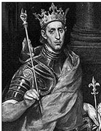
El Greco: Szent Lajos, 1592-95 olaj, 120 x 96 cm, Louvre, Párizs

Steven Runciman három kötetes könyve a keresztes hadjáratok történetét beszéli el. Kronologikus rendben tagolva részletesen kifejti a keresztes szellem születésének körülményeit és az első keresztes hadjáratot, majd a 12. századi, fordulatot hozó eseményekről ír, végül a kései keresztes hadjáratok és a Tengerentúl története zárja a művet. Nagyívű, korokat, helyeket, népeket, eseményeket és személyeket átfogó szemlélettel összefüggésbe állító történeti mű. A keresztes hadjáratok irodalmában sajátos hely illeti meg komplexitásra törekvő megközelítése, tudományos tényekkel való alátámasztottsága és ugyanakkor személyes – akár vitatható – látásmódja miatt.