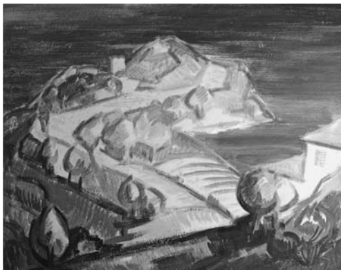
Taormina , 1969, olajtempera, farost, magántulajdon

Mazsaroff Miklós minden ecsetvonása arról árulkodik, hogy örömet lelte a mediterrán táj színpompájában, szépségében, gyönyörködött benne, elmerülve tanulmányozta és költői szemlélődésének tárgyává