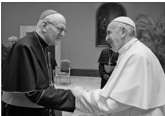
Erdő Péter bíboros Ferenc pápával

Harminc évvel ezelőtt elterjedt Magyarországon a meggyőződés, hogy el kell hagyni a szocialista rendszert és át kell térni a kapitalizmusra, vagy esetleg egy „harmadik típusú” rendszerre. Lehetett tudni, hogy a nagyhatalmaknak az a szándéka, hogy ez az átmenet békés módon menjen végbe. Tudott dolog volt, hogy az Egyesült Államok és a Szovjetunió megállapodott Máltán ennek a változásnak a főbb pontjairól. Így azután meg- lehetős elégedettséggel láthatták az emberek, hogy érvényét veszítette a jaltai egyezmény, amely a háború győztesei között felosztotta Európát. Ugyanakkor szükségét érezték annak is, hogy ne változzanak meg az európai nemzetállamok határai, és csak a föderatív államok válhassanak szét a már létező föderációs államok határai mentén. Ez a fölfogás tűnt Európában a nemzetközi béke biztosítékának.