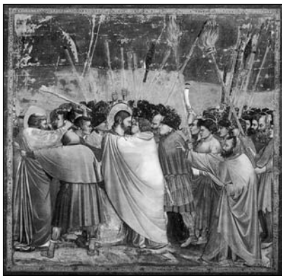
Giotto: Júdás áruló csókjá (Padua)

A következő képen Júdás áruló csókját látjuk, ez már a csütörtöki nap története. Giotto a gótika határán és a reneszánsz kezdetén élő művész volt, Firenzében alkotott. 1267-ben született és 1337-ben halt meg. Leg-