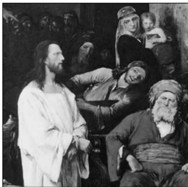
Munkácsy Mihály: Krisztus Pilátus előtt (részlet)