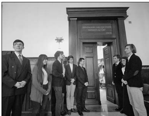
A vendégek fogadása