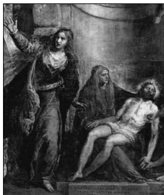
Tiziano: Pieta (részlet)

vannak festve, ezzel is fokozza a perspektívát, mintha mindannyian ezt várnák és átadnák magukat ennek az óriási szertartásnak. Itt mondja Jézus, hogy ti is ezt tegyétek. Legyetek alázattal és szeretettel.