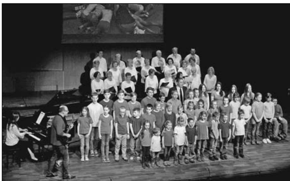
Gyerekek és a gyülekezeti kórus

2008. január 1-től vagyok – feleségemmel együtt – az Avas-Dél Lakótelepi Református Missziói Egyházközség lelkipásztora. 2016. március 13-án jótékonyági estélyt rendeztünk a Művészetek Házában, melynek kettős célja volt: „bemutakozni” az érdeklődőknek, illetve hivatalosan is elindítani a templom/gyülekezeti ház építését elősegítő adakozást.