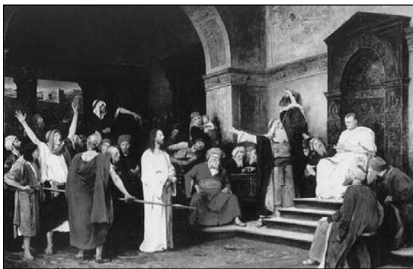
Munkácsy Mihály: Krisztus Pilátus előtt

A képen kicsúcsosodik egy olyanfajta összecsapása több embercsoportnak, ami nagyon érdekes. Hármasszoros összetevője van, Jézusnak és Kajafásnak a szembenállása, Jézusnak az előljárókkal való szembenállása és Kajafásnak a néppel való szembenállása. Ha megnézzük a képet, csoportokat látunk, az előljárók csoportját közel a lépcsőhöz Pilátus mellett, látjuk a háttérben a népet, a katonákat és még jobboldalon is vannak előljárók. Ezért a képet nem tudjuk teljes egységében nézni, nem ad egy optikai egységet. Mindig valahol megakad a szemünk. A vörös ruhás férfi Kajafás, ő egykedvűen és józanul ül, úgy néz ki, mint aki a törvényt nagyon tiszteli, és be akarja tartani. Teljes fölénnyel nézi a dolgokat, abban reménykedik, hogy úgyis teljesülni fog, amit ő szeretne.