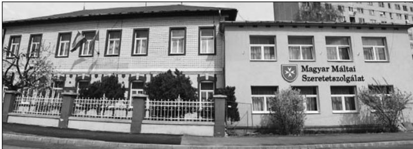
A szeretetszolgálat központja az Árpád utca 126. szám alatt

(A Szent Anna Kolping-házban március 14-én tartott előadás szerkesztett változata)