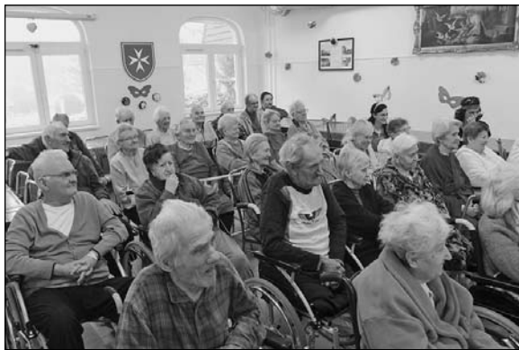
Műsor az ápolási otthon lakóinak

Az Ápolási otthon Magyarország egyetlen olyan egészségügyi intézménye, ami nem kórházon belül működik. Ápolási osztály sok helyen van, a Diósgyőri kórházban,