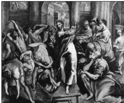
El Greco: Kufárok kiűzése

Greco -nak egy csodálatos képét látjuk, a Kufárok kiűzését. Greco Krétán született, de Velencében és Toledóban tevékenykedett. Az olasz-spanyol festészetnek kiemelkedő alakja. Nagyon sok új dolgot hozott a festészetbe, nemcsak monumentalitásában, hanem kompozícióiban is. Az ő alakjai robusztusak, a barokkot is megelőzi annyiban, hogy ég és föld között lebegnek a figurák. Greco sikeres művész volt, Velencében Tizianótól tanulta a festés alapjait. A manieristák kezdeti korszakait mutatja Greco. Olyan sikeres művész volt, hogy II. Fülöp is pártfogásába vette. Toledóban műhelyt alapított, ahol tanítványaival dolgozott. Úgy tudjuk, hogy az idősebb Brueghellel is.