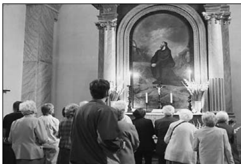
Székely Bertalan: Jézus az olajfák hegyén (Miskolci Belvárosi Evangélikus Templom)

Városunk büszkélkedik egy nagy mester munkájával, a belvárosi evangélikus templomban. Ez egy csodálatos oltárkép, melyet Székely Bertalan festett. Ez Krisztus az Olajfák hegyén című munka, Jézus szenvedését ábrázolja. Óriási, nagyméretű kép, amit