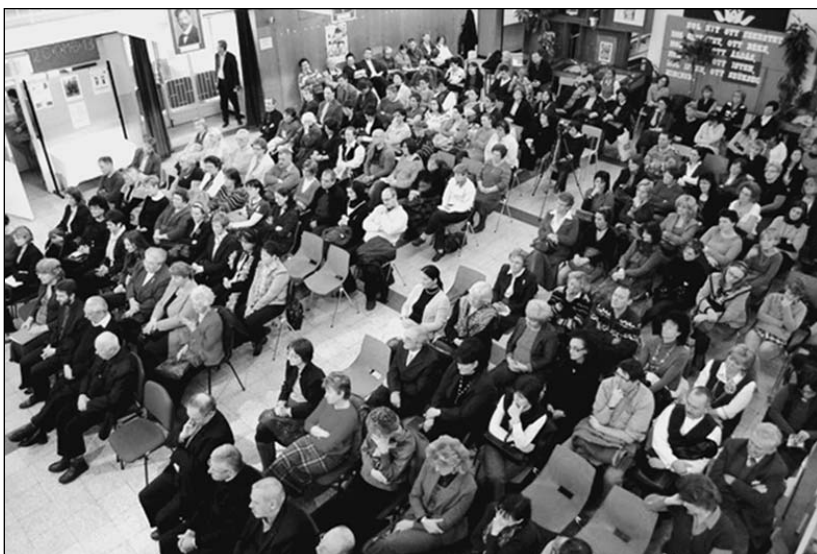
Nagy érdeklődés övezte a találkozót