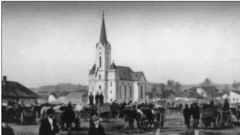
A templom felszentelése óta nagyot változott a Búza tér