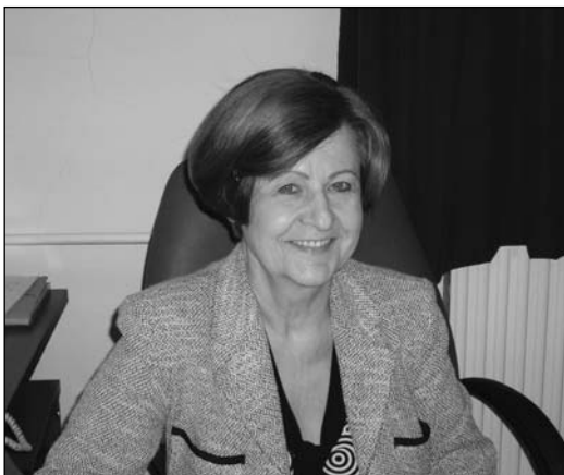
Dr. Bagdy Emőke professzor asszony

mindnyájan, hogy milyen pusztító, ami történik az életünkben, az a felgyorsult hajsza, amiben próbálunk valahogy egyensúlyba kerülni. És mindnyájunkban, személyesen mindenkiben ott van a határozott döntés: máshogy kellene. Miközben jó életminőségre vágyunk, szeretnénk, hogy jól érezzük magunkat a bőrünkben, hihetetlen manipulatív hatásoknak vagyunk kitéve. Például ugye azt üzenik: legyél már boldog, és legyen neked ilyen-olyan anyagi javad, attól majd boldog leszel. Na hát akkor csak hajtsd érte, dolgozz csak, dolgozz, és hogyha megvan a pénz, akkor vedd meg, mert hogyha megvetted: boldog leszel, mert akkor neked lesz valamid. Közben ne felejtjük el,