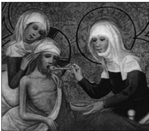
Szent Erzsébet beteget ápol

Szolgálatunk Árpád-házi Szent Erzsébetről vette a nevét. Érdemes egy picit tanulmányozni ezt a képet. Az ápolást ketten végzik: Erzsébet, aki a csonttá-bőrré lesaványodott, teljesen elerőtlenedett beteget eteti és egy másik apáca, aki testével támasztja, bal kezét a vállán nyugtatva megéri, bátorítja, jobb kezével pedig éppen a homlok simításából visszavonulva szereti, vigasztalja, psziché-