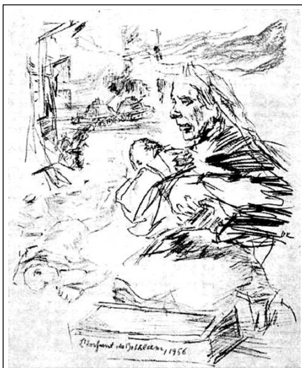
Oskar Kokoschka grafikája 1956 magyar karácsonyáról

Márai vigasztaló, kétségbeesetten is reménykedni akaró szavai jólesők voltak-lehetek, mint a csillogó papírba csomagolt, szegényes cukorkák a fenyőfán. Úgy dűny-