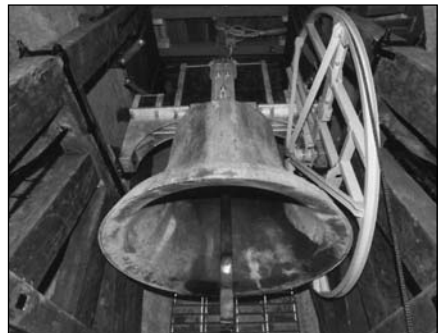
Az Eszter-harang felújítás után