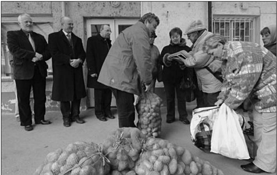
A karitás 360 zsák burgonyát osztott szét Miskolcon