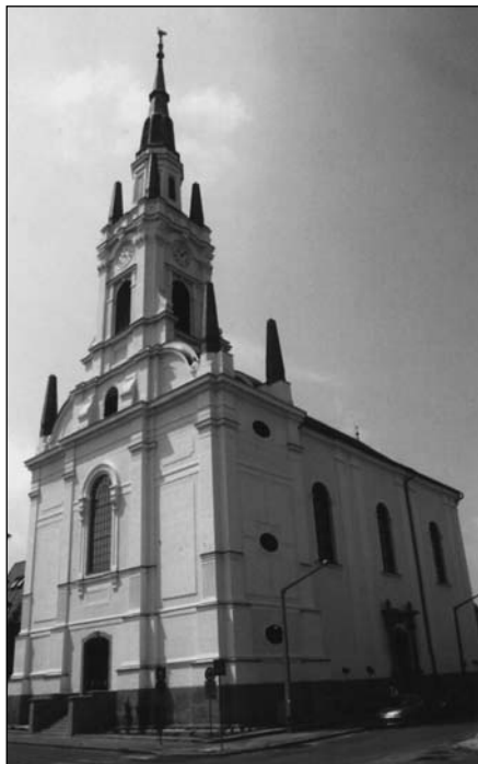
Erő és méltóság