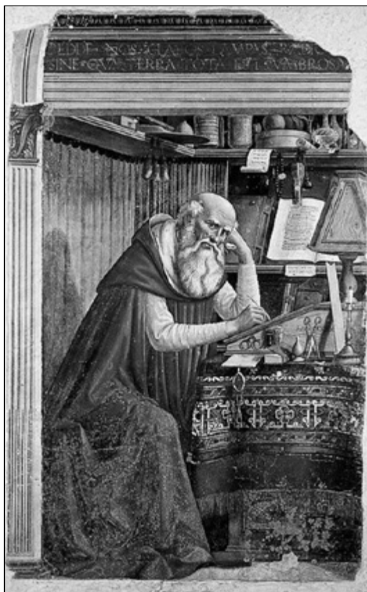
Domenico Ghirlandaio: Szent Jeromos

mintegy száz évvel később szervezte meg a nyugati szellem szerint a szerzetességet. Benne találkozott a nyugati szellemiség és a kereszténység. Jeromos tehát a szerzetesek között élt, de azok az egyiptomi remetéknek a nyugatra települt tagjai közül kerültek ki. Meglehetősen kiforratlan formája volt a szerzetesi életnek. Trierből Milánóba ment, és azt mondta, itt az ideje, hogy Isten dolgaival foglalkozzam. Ezt a családjának is tudomására hozta, és a keresztény családja rossz néven vette tőle, hogy a kereszténységgel behatóbban akar foglalkozni. Látszik, hogy az embereket mennyire nem hatotta át a kereszténység: a keresztény család zokon vette, hogy behatóban foglalkozik a keresztény hittel. Nem hatotta át a kereszténység abban az időben Rómát sem, mert Nagy Szent Gergely pápa idejében, akit 590-ben választották meg pápává, tehát 160 évvel azután, hogy Jeromos élt, még rabszolgaviadatok voltak és rabszolgapiac volt Rómában. Gergely pápa a rabszolgapiacon vett meg olyan embereket, negyvenen voltak, akiket kiképzett papoknak és elküldte őket Angliát meghódítani.