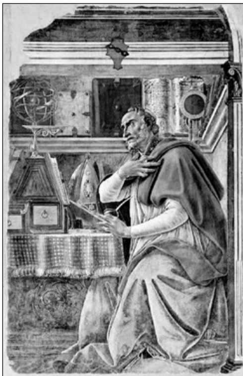
Boticelli: Szent Ágoston

Csakhogy a retorika külső köntöse mögött a tartalom iránti érdeklődés és nyitottság is egyre inkább erőre kapott. Ismét csak a Vallomásokat idézhetjük: „Ambrus tanításainak megismerésére egyáltalán nem iparkodtam. Azt figyeltem csak, hogyan beszél. Kétkelkedtem immár, hogy az ember még utat is találhat feléd, s így csupán ez a biú törődés maradt meg nekem. Ám de a megkedvelt szavakkal együtt a tartalom is szívembe szállingózott, pedig csak fitymálva tekintettem reája, a kettőt ugyanis el nem választ-hattam. És midőn a szívem kinyitottam, hogy ízlelgessem édes szavait, egyúttal, habár csak fokról fokra, de a szavakban hirdetett igazság is szívembe lopózott... Kezdetben csak arra nyílt meg szemem, hogy az igazság is védelmezhető. Később a katolikus hitet – bár akkor kialakult véleményem szerint támogatására nem volt felhozható semmiféle bizonyíték a manicheusok támadása ellen – már szégyen nélkül is megvallhatónak láttam, főleg, miután az ószövetségi könyvekből hallottam néhány homályos kérdés igen talpra-esett megoldását. Míg őket betű szerint magyaráztam, a betű engem is megölt. Midőn tehát e könyvek több helyének fejtegetését lelki értelemben hallottam, már meg is róttam a reménytelenségemet, amellyel úgy gondolkoztam egykor, hogy a Törvény és a Proféták arcátlan elutasítóinak senki sem állhat ellen... Arra azonban még nem gondoltam, hogy