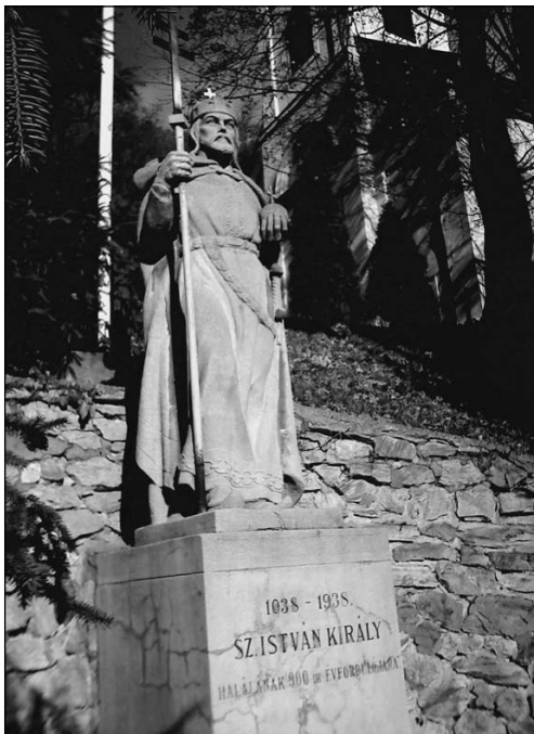
Szent István király szobra Felső-Hámorban

Az ő példáját követve, égi pártfogásában bízva akarunk átlépni a jövő kapuján, akarunk egy új, gazdagabb, erősebb, emberibb országot építeni a harmadik, évezred hajnalán.