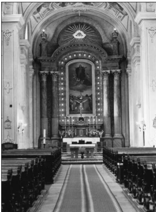
A miskolci Minorita Plébániatemplom Nagyboldogasszony-fooltára

A XVIII. századra a Regnum Marianum, Mária királyságának gondolata szépen kiformalódott. Alapja az Árpád-házi szentek erős Mária-tisztelete, és ezeknek a szenteknek a tisztelete volt, ezt koronázta meg a Patrona Hungariae, a Magyarok Nagyasszonya tisztelete. A koronázásra is érdemes utalni, a XVII–XVIII. században került fel az úgynevezett koronázási eskükeresztre a Magyarok Nagyasszonya, egy sajátos formában. Erről a formáról érdemes beszélni. Már az eskükereszten is azt láttuk,