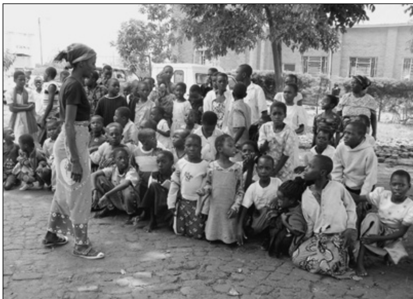
Intenzív után a tanító nénivel

A missziós együttműködés előzményei között szerepel, hogy immár 26 éve ápol kapcsolatot a tiszáninneni egyházkerület az Egyesült Államok Első Presbiteriánus Egyház Missouri Egyházkerületével. 2004-ben vetődött fel annak gondolata, hogy ebbe a testvéri közösségbe be kellene venni a missouriak másik testvér-egyházkerületét, a