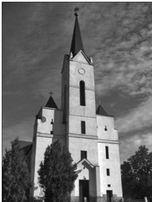
A miskolci görög katolikus templom

A válasz a püspökségre bizonyára hamar beérkezett, s az újabb felterjesztés is Budára. Eredmény nélkül.