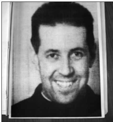
Isten szeretete mosolyán

Működése és életpéldája nemcsak egy dél-amerikai országra, Chilére vonatkozik.