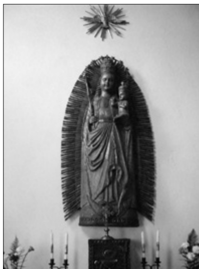
...és a madonnaszobor másolata a tusnádi templomban