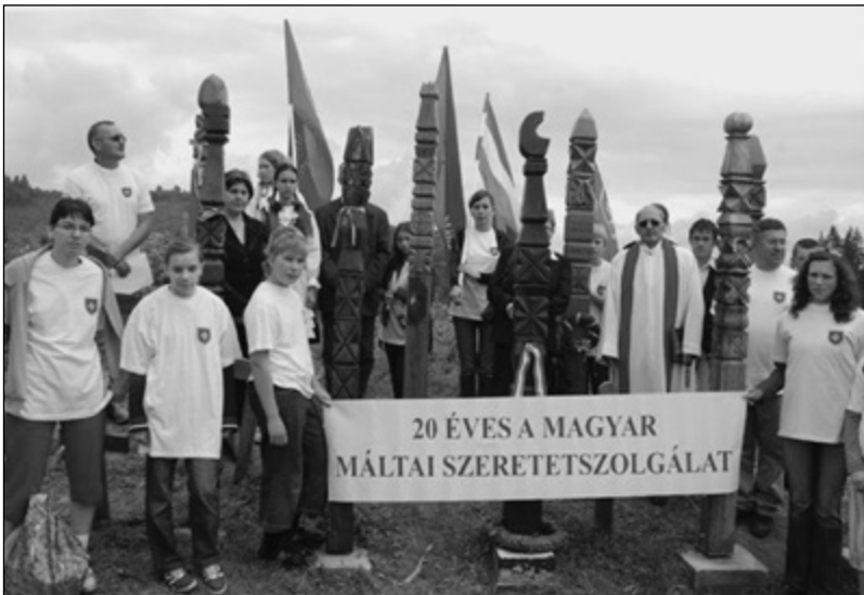
Máltai zarándokok a nyergestetői kopjafaállításon

A reggeli után Nyergestetőre indult a társaság, egy kopjafaállításra. 1849. augusztus 1-jén a cári orosz csapatok lemészároltak itt kétszáz magyar honvédet, akik a hatalmas túlerővel szemben hősiesen helytálltak, amíg egy román pásztor el nem árulta őket, nem is tudták bevenni állásaikat. Valamennyi hősi halottat a csatamezőn temették el az oroszok, a hősöknek kijáró tiszteletadás mellett. Sírjaik fölött kopjafaparkot alakítottak ki az utódok, talán száznál is több a helyiek és a Magyarországról idelátogató csoportok, egyesületek, magánszemélyek által felállított kopjafák száma. (Az év elején Sólyom László köztársasági elnök állított egyet: ez volt az az emlékezetes eset, amikor a románok nem engedték a repülőgépét leszállni, s ezért autóval tette meg az utat.) Zarándokutunk máltai szervezői helyi fafaragóval készítették el azt a kop-