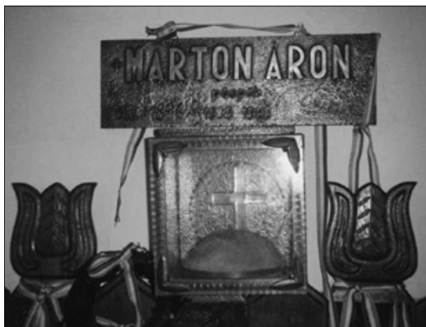
Márton Áron pileolusa...

Mindig van itt valaki, mindig jár erre vándor, aki szétviszi a hírt, hogy azok, akik itt elesetek 1849. augusztus 1-jén, nincsenek elfelejtve, több mint 160 év távlatából is velük van az egész magyarság.