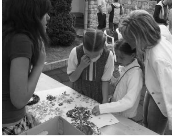
Családi juniális a Jezsuitában

Szeretnénk az évre hangsúlyokat megfogalmazni, melyek segíthetik a tervezést és a közös megjelenést. Olyan nagy témák látszanak igazán fontosnak, időszerűnek számunkra, mint az igazságos társadalom szolgálata, a hitre és a hétköznapi, alázatos szolgálatra épülő tapasztalatlaknak (főleg a szétszórásban) és ennek sokszínűségének a megosztása, a világgal való dialógus és rendi életünk erősebb együttműködése keresztényekkel és nemhívókkal egyaránt.