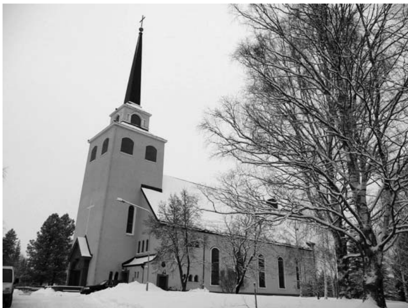
A kiuruvesi evangélikus templom