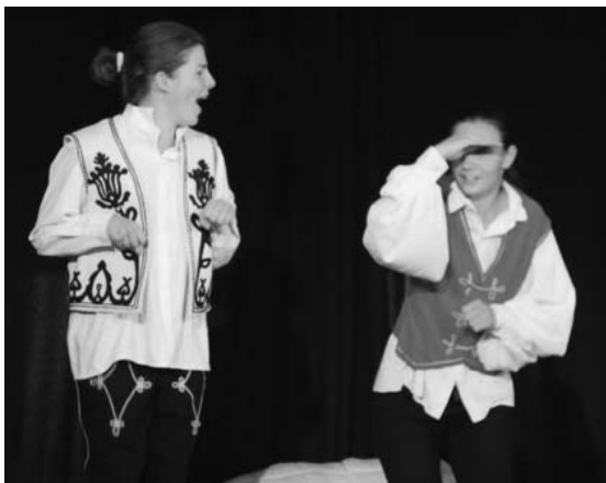
A Lúdas Matyi a francia színjátszóink előadásában

Akkor éreztem: mindegy, honnan jövünk, milyen nyelvet beszélünk, mert egyek vagyunk. A táncházban is fantasztikus volt a hangulat. Nagyon közvetlenek, vidámak és barátságosak voltak, s ez egész héten sugárzott felénk. Valami újat mutattak a próbák alatt is: a mindennapi és feltétel nélküli szeretetet. Nem az számított, hogy jól éneklünk vagy táncolunk – persze ez is fontos volt bizonyos szempontból –, de az igazán lényeges az volt, hogy együtt csináljuk. Mindenre