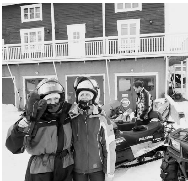
Motoros szánozás előtt...