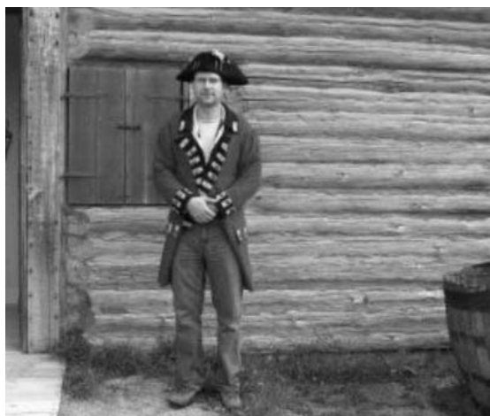
Az erőd előtt, mint „vöröskabátos”

múzeumokban eredeti indiánruhát, békepipát, fejdíszst. látni. Az egyik boltban meg is leptem magam egy békepipával, ami persze új, de egy indián képzőművész készítette.