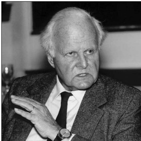
Carl Friedrich von Weizsäcker

A Miskolci Keresztény Szemle rovatot indított „Ismeretlen arcélek” címmel. Ebben a rovatban időről-időre, Magyarországon jórészt ismeretlen XX. századi európai személyiségek életútját, munkásságát kívánjuk bemutatni, akik saját működési területükön kiemelkedőt alkottak, valamint kereszténységüket is tudatosan vállalták, azt a közvélemény számára tevékenységükkel, megnyilatkozásaikkal hitelesítették.