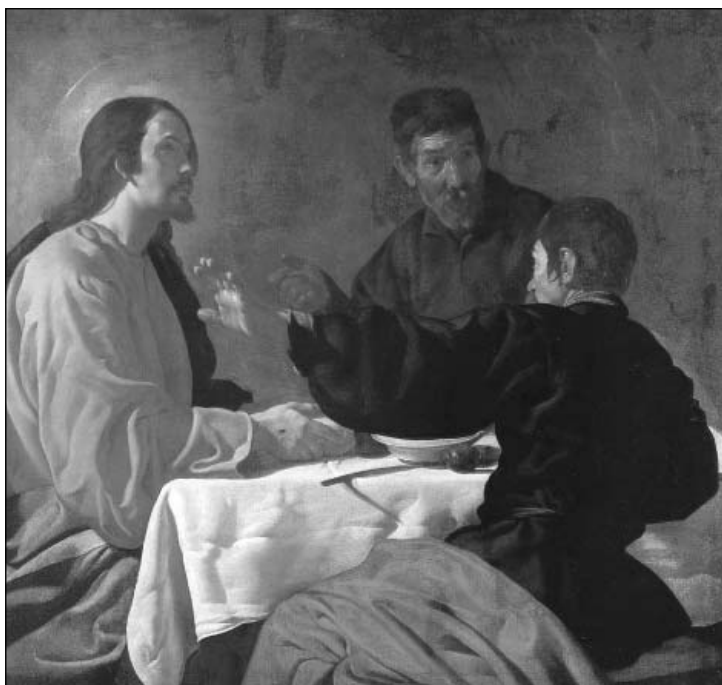
Velazquez: Az emmauszi úton

szeretteink közelsége megnyugtató bennünket elalvás előtt, úgy most – alkonyunk idején – hasonló érzéssel, reménnyel kérjük Öt, maradjon velünk. Mert bár hiszünk az örök életben, tudjuk, hogy földi létünk megpróbáltatásai ebben a távlatban nézve értelmet nyerne, mégis szükségünk van támogatásra, erős, határozott, megbízható útitársra.