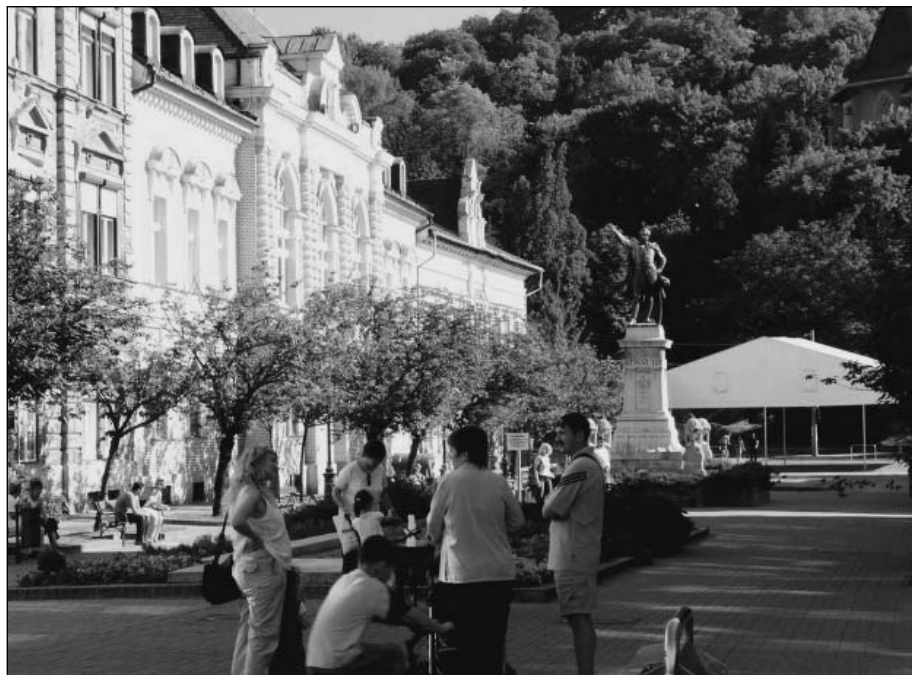
A tér – háttérben a természet

Dobrossy István több helyütt is részletesen leírta a tér keletkezését, történetét. A nagy árvíz után a Pap-malom végleges elbontásával kialakult üres területen szándékosan városi teret kívántak kialakítani a városvezetők. Az Avast, amelynek oldalában egykor született, s ahonnan leköltözött a központja a jelenlegi főutcai tengelyre, a város szinte teljesen kizárta magából. Egyáltalán, a főutca teljes egészében mesterséges