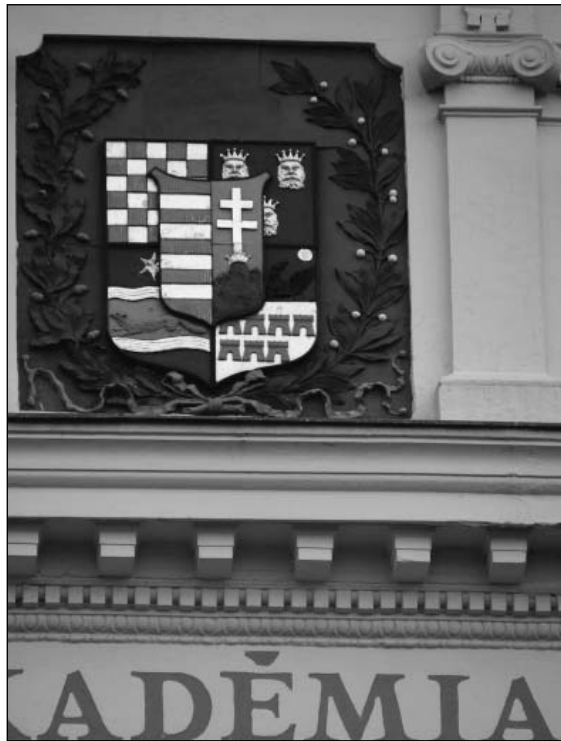
Az Akadémia hibás címere – a horvát „sakktabla” és a dalmát oroszlánok helyét cseréltek

A tér szinte teljesen kiépült, foghíj nincs rajta, így mivel bontásra nem számíthatunk, az elrontás veszélye nem fenyegeti. Vitát váltott ki szakmai berkek-