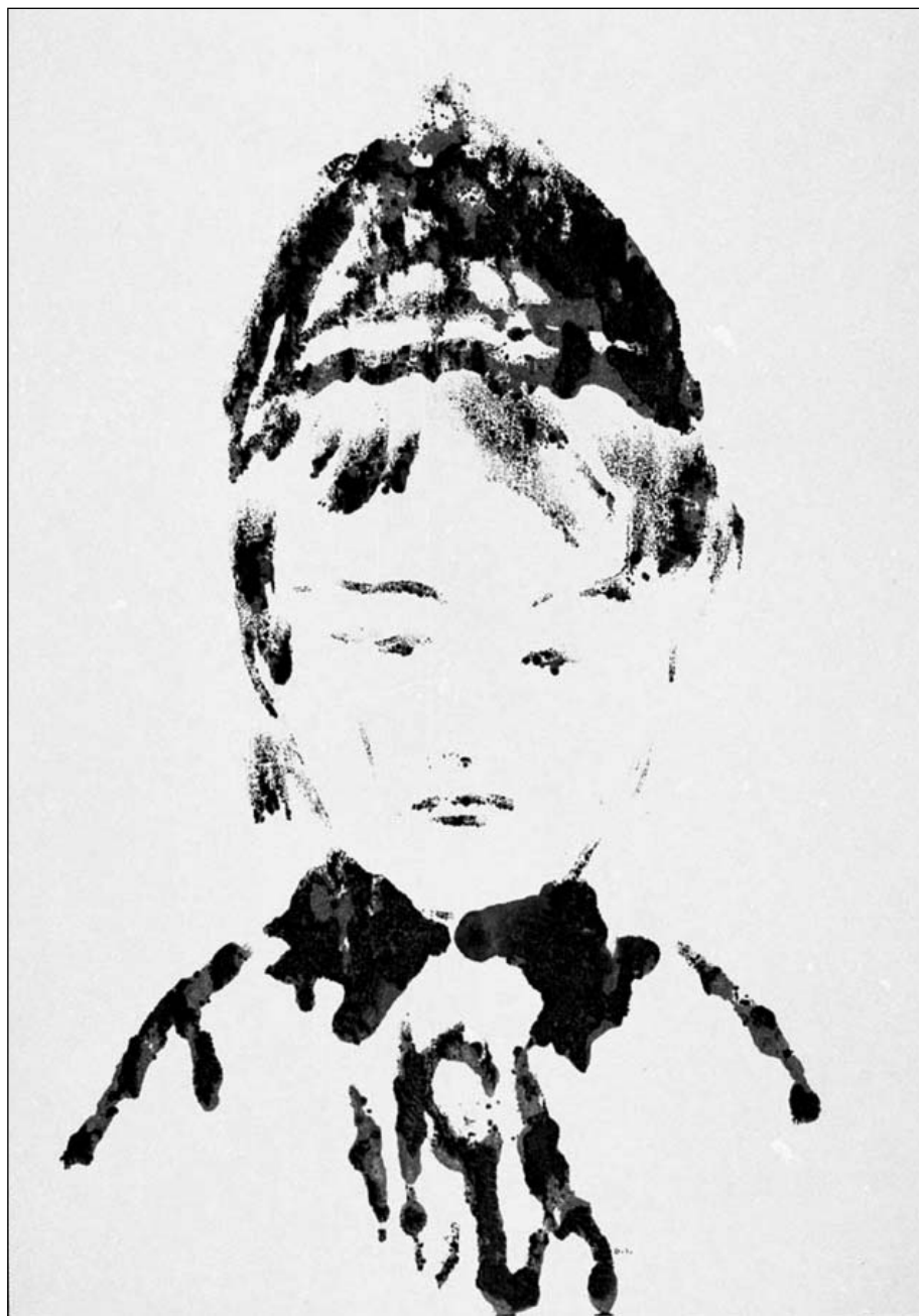
Demeter István akvarellje