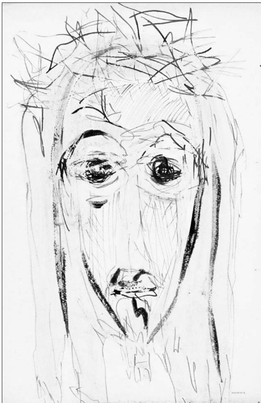
Akit érettünk tövissel megkoronáztak