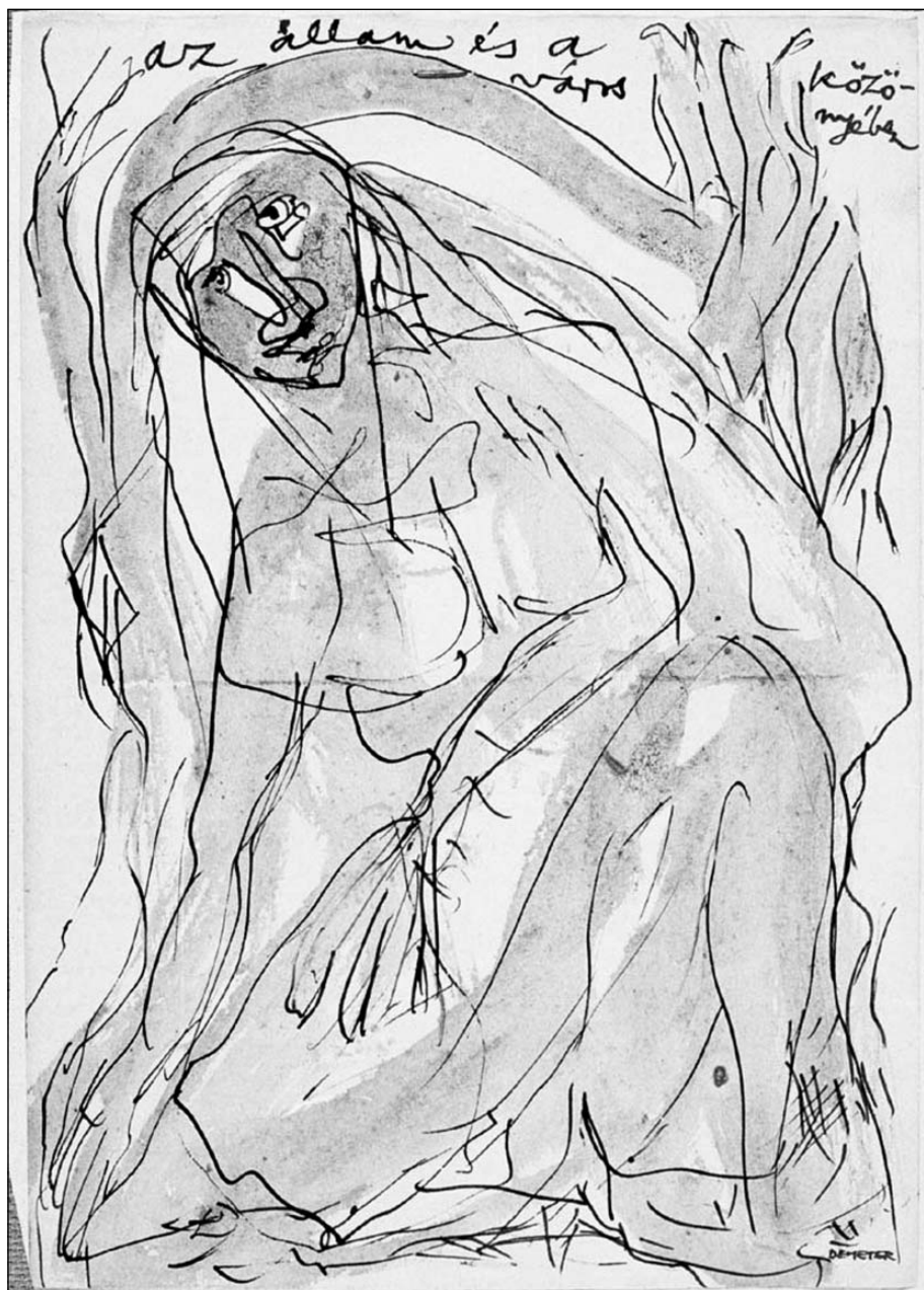
Az állam és a város közönyében